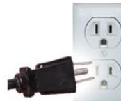
Tipo B: A veces válido para clavijas A