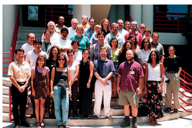
IAI-UM Summer Institute Group 1999

En el primer Instituto de Verano, se exploraron las conexiones entre la variabilidad climática asociada principalmente al fenómeno de El Niño-Oscilación Sur (ENOS), con importantes sectores socioeconómicos (agricultura, manejo de los recursos hídricos) — en particular, las implicancias de la capacidad emergente para pronosticar la ocurrencia de eventos ENOS con varios meses de anticipa-