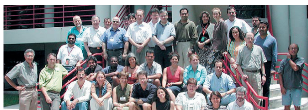
IAI-UM Summer Institute Group 2000