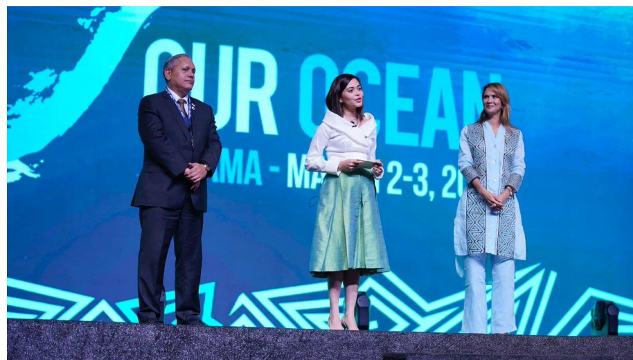
VIII edición de la Conferencia OUR OCEAN llevada a cabo en Panamá en marzo 2023.