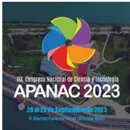
XIX Congreso Nacional de Ciencia y Tecnología Asociación Panameña para el Avance de la Ciencia 2023