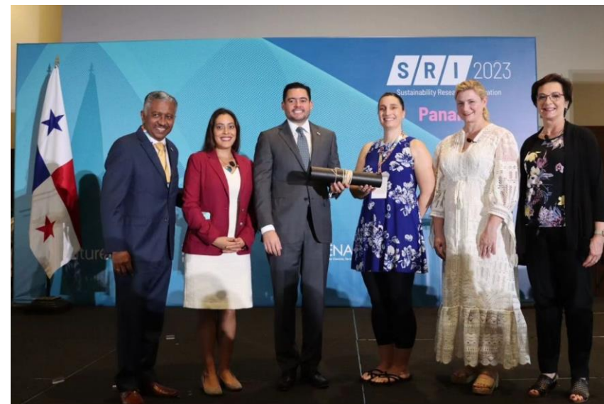
Congreso de Investigación e Innovación en Sostenibilidad 2023 (SRI2023)