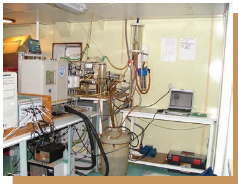
CO 2 lab on board / Laboratorio de CO 2 a bordo.

elaboraran propuestas para avanzar lo mejor de su ciencia, sus líneas de investigación más prometedoras, y así continuar apoyando los equipos transdisciplinarios más innovadores. Se seleccionaron las propuestas sobresalientes mediante una evaluación y selección por panel a cargo del Comité Asesor Científico del IAI. Trece proyectos hicieron sus presentaciones, de los cuales 9 fueron seleccionados para ser financiados bajo el Programa de Pequeños Subsidios para Investigación Cooperativa en las Américas (SGP-CRA).