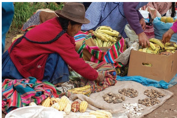
Ecosystem services sustain different livelihoods / Los servicios ecosistémicos mantienen diferentes medios de vida.

Los enfoques interdisciplinarios son necesarios, pero no suficientes para proteger y manejar la biodiversidad y sus beneficios para la sociedad de forma sustentable (Metas Aichi 1 y 2). La gobernanza de los ecosistemas es un elemento indispensable de la ecuación. El desafío es consolidar estos conocimientos, y convertirlos en sistemas económicos, políticos y de gobierno efectivos. Esto es algo que la comunidad científica no puede lograr por sí sola: se trata de un esfuerzo intersectorial e interdisciplinario.