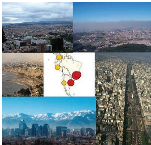
The large urban centers in South and Central America keep growing posing serious environmental and health problems // Los grandes centros urbanos de América del Sur y Central continúan creciendo generando serios problemas ambientales y de salud

por enfermedades respiratorias o cardíacas. Mediante el análisis de series temporales en la ciudad de Buenos Aires los investigadores mostraron que al día siguiente de un aumento del 1% en la concentración de monóxido de carbono (un buen indicador del nivel general de contaminación), podía esperarse una mortalidad 4% mayor. Si bien el proyecto analizó la correlación entre contaminación y mortalidad cardíaca o